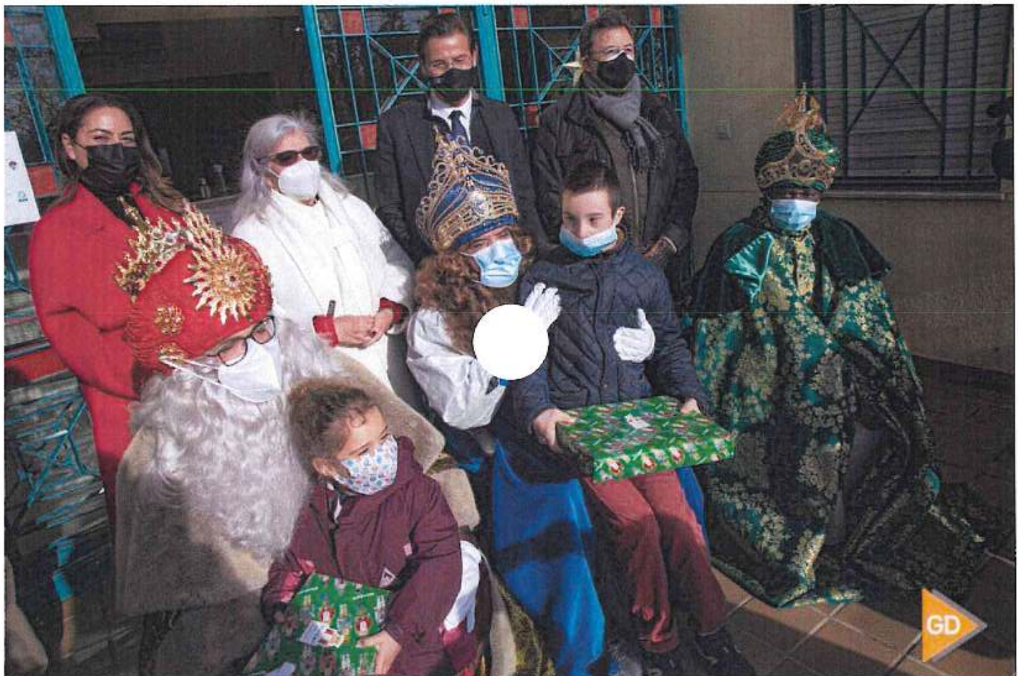
Los Reyes Magos en su visita a la sede de GranaDown

Sus Majestades comenzarán a las 17:00 horas su recorrido en autobús descapotable por las calles de los ocho distritos de la capital