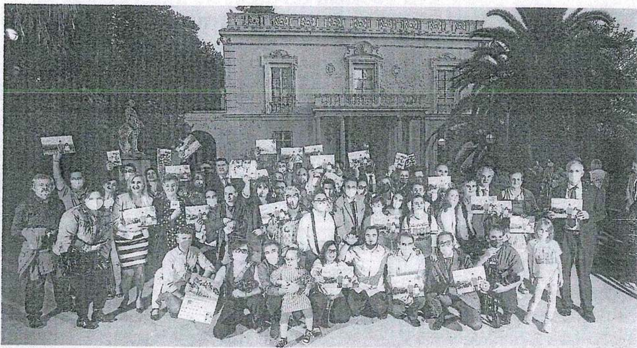
Foto de familia en el acto de presentación del calendario de Granadown.